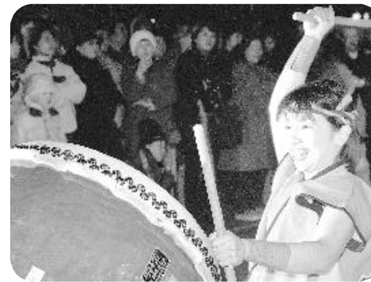
O・TA・I・KO座明神コンサート 21世紀バージョン