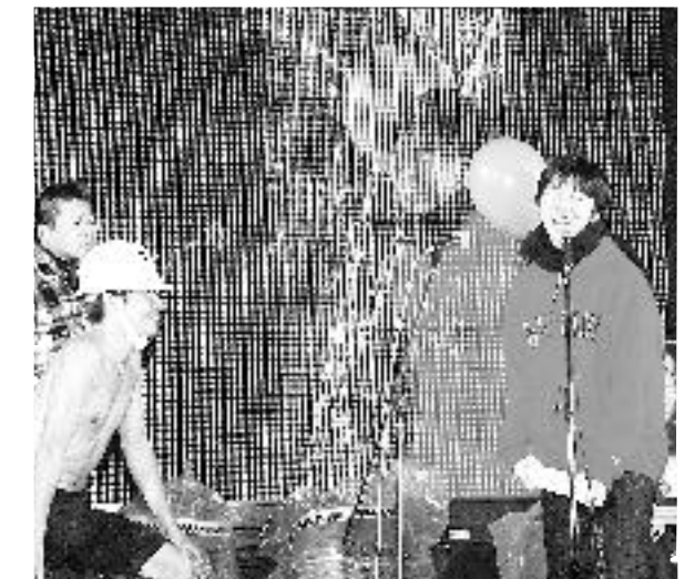
20世紀、絶叫!うさばらし大会