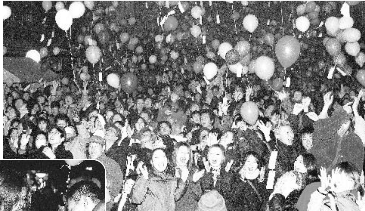
「待ってたよ～、21世紀！」歓喜に湧くカウントダウンの瞬間

2001年(平成13年)1月1日0時、神楽町通り特設会場で「きらめいて、つるが センチュリーカウントダウン21」が開催され、およそ7,000人の市民のみなさんが新世紀幕開けの喜びを分かち合いました。