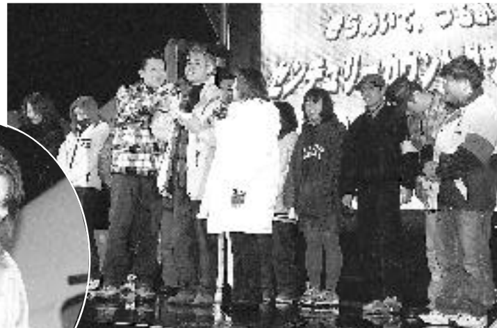
初夢大福引抽選会