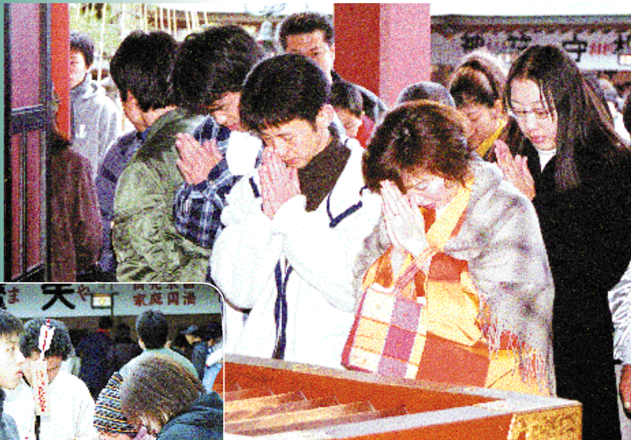
よい年になりますように（初詣・氣比神宮）