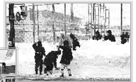
1月17日～21日にかけて、市民のみなさんの懸命な路地の除雪、屋根雪下ろし・排雪作業が続いた。