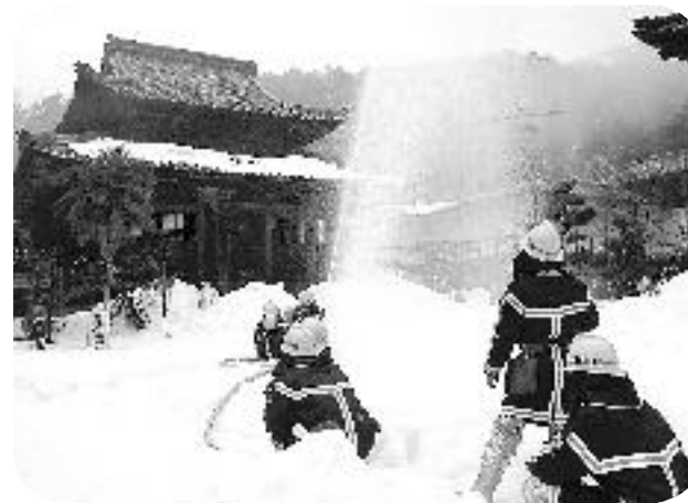
わしらが 1月26日 でえ

文化財防火デーのこの日、西福寺で文化財火災防御訓練が行われました。当日はまだ境内に40cmほどの積雪があり、消防車が入れない中での実戦さながらの訓練となりました。消防署はもとより、地元消防団、原区民、婦人自衛消防隊などおよそ50人が貴重な文化財を守るため、真剣に訓練に臨みました。