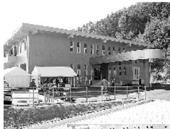
福井県敦賀原子力 防災センター 2月24日 開設式

原子力緊急事態応急対策拠点施設（オフサイトセンター）の指定を受けた「福井県敦賀原子力防災センター」が美浜、高浜、大飯の同センターとともに開設しました。この施設は、万一の原子力災害時に国、県、関係市町村、警察、消防等の防災関係機関が集結し、一体となって災害応急対策などを行なうための拠点施設で、必要となるスペースの確保、通信や情報収集などに必要な機器を整備しました。河瀬市長は、式典の中で「この拠点施設が、市民の安心と安全のため十分役割を果たすことを期待する。」と述べました。