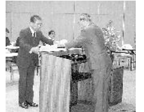
補導員委嘱状交付式(5月19日)

を増やしたり、特別時間帯を設けて巡視の強化に努めています。 昨年からはじめた「地域のおじさん、おばさん運動」も一段と推進されていますが、市民のみなさんも青少年の非行につながるような行為を見かけたときは「愛のひと声」をかけていただき、心豊かな青少年の育成にご協力をお願いします。