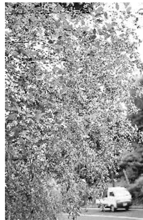
〈ふるさと敦賀の花 はぎ〉の部 最優秀賞 題名：乱れ咲く萩花