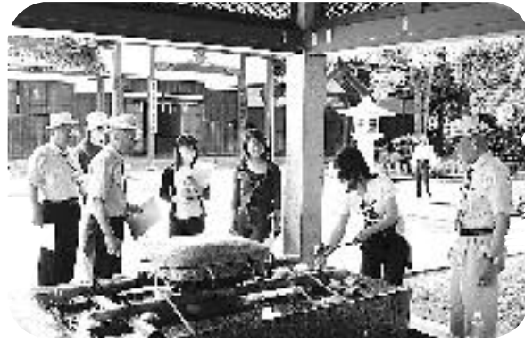
さっそくの研修会で敦賀のよさを再発見!

7月2日(月)、平成13年度の「観光敦賀キャンペーン隊」の委嘱式が市役所で行われました。昨年からの名称を新たに、年齢、性別、市内外を問わず広く募集を行ってきました。 厳正な審査の結果、3人が選ばれ、平成14年6月30日までの1年間、それぞれの個性を生かし、「敦賀」を全国に、世界にPRしてくれます。 問合せ 観光課内 敦賀観光協会 ☎ 22・8128