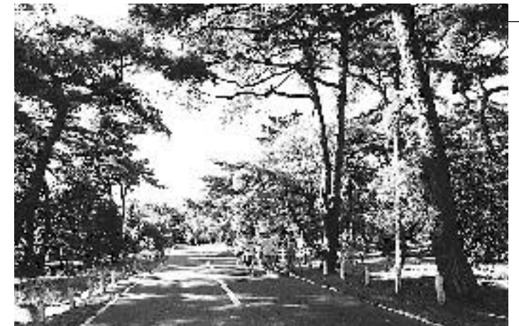
〈ふるさと敦賀の木 まつ〉の部 最優秀賞 題名：陸上練習の松原公園