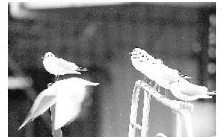
〈ふるさと敦賀の鳥 ユリカモメ〉の部 最優秀賞 題名：可愛い水兵さん達