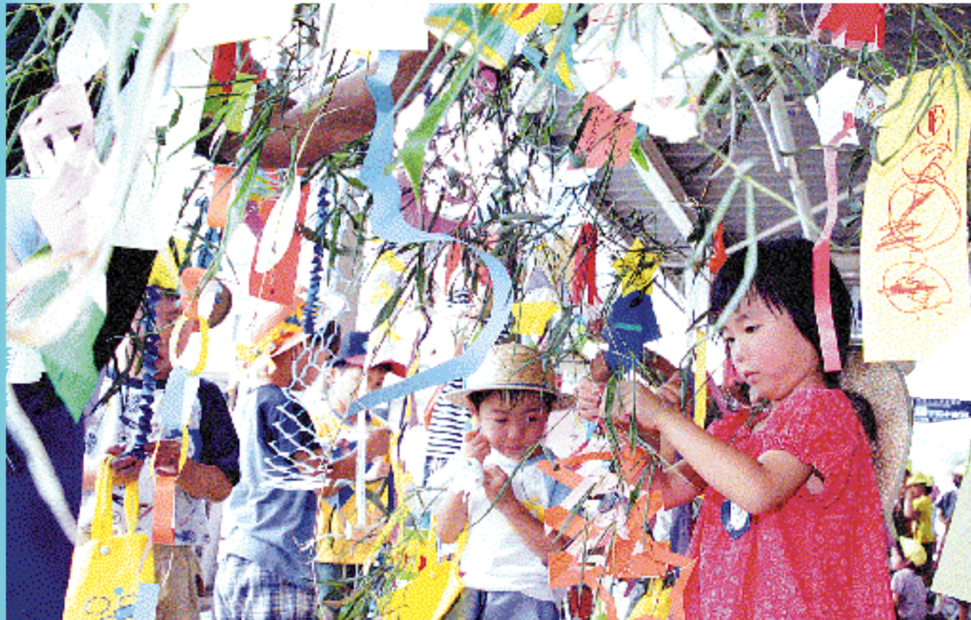
願いが叶いますように！（7月2日 七夕飾り：敦賀駅）