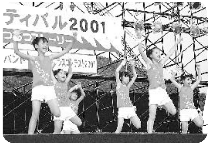
きらめきダンスコンテスト(20日)