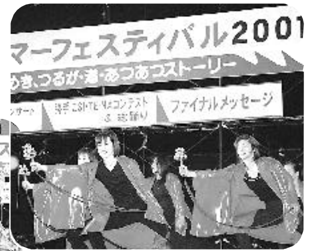
勝手にS・I・T・E・N・Aコンテスト(22日)