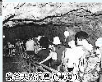
泉谷天然洞窟(東海)