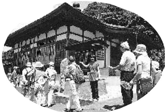
金ヶ崎ストーリーウォーキング(20日)