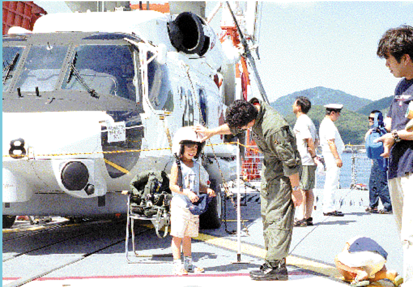
ぼくもパイロット！（8月4、5日 護衛艦「みねゆき」一般公開）