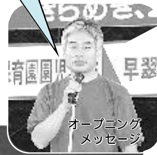
オープニングメッセージ