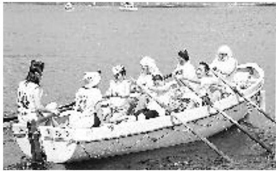
カッターレース(20日)