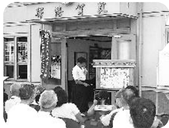
ジャンボ紙芝居(20~21日)

参加した329人のみなさんは、お隣の国・韓国の雰囲気を楽しみ、また、豪華客船での優雅な船旅を満喫されていました。