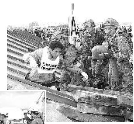
平成10年度 防災総合訓練より