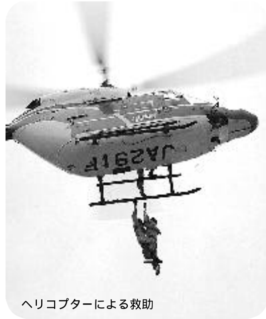
ヘリコプターによる救助