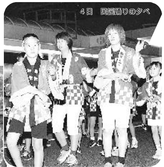
4日 民謡踊りの夕べ