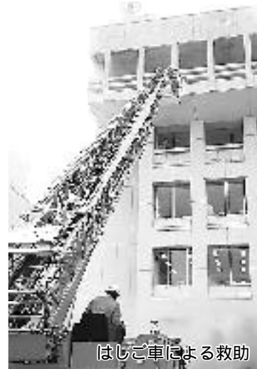
はしご車による救助