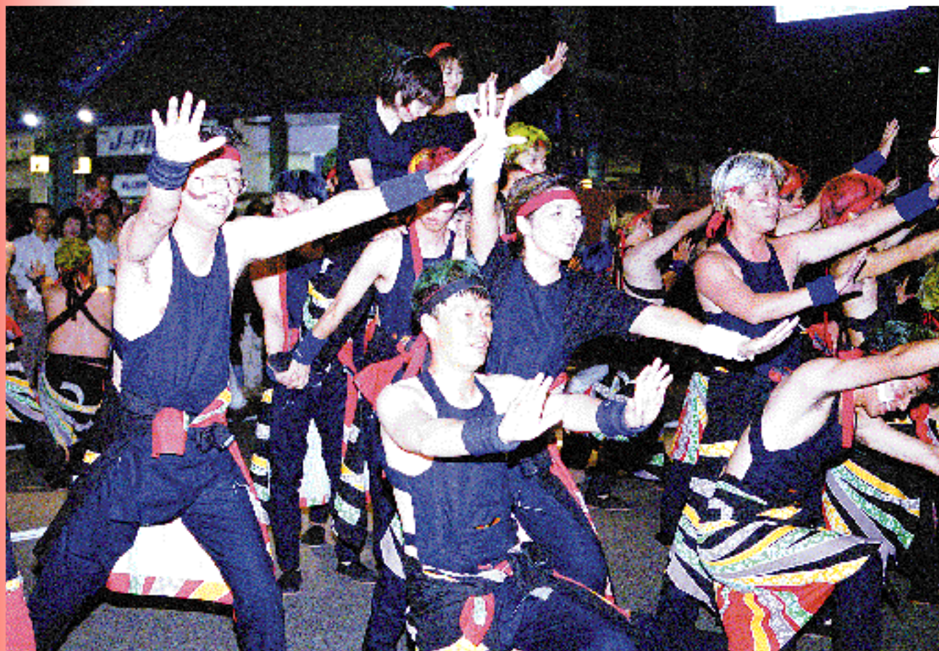
よっしゃ、決まった！（9月1日 / 敦賀まつり カーニバル大行進）