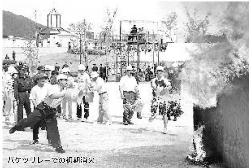
バケツリレーでの初期消火