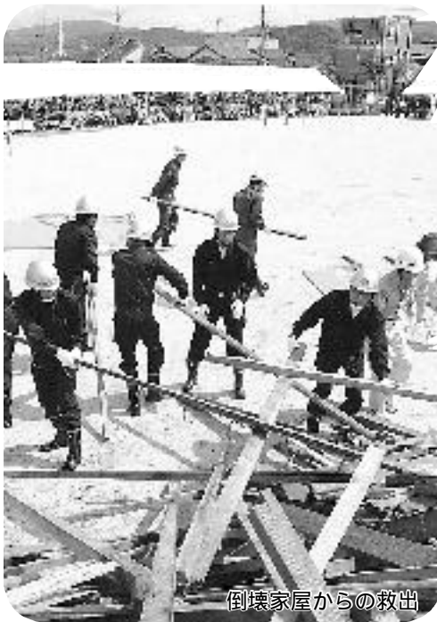
倒壊家屋からの救出