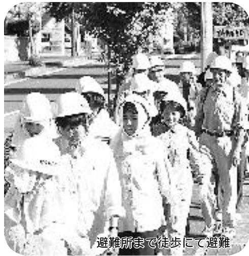
避難所まで徒歩にて避難

9月1日防災の日、松島中央公園と市役所を中心に敦賀市防災総合訓練が行われました。西・松原・西浦地区のほか16機関、およそ1,000人が30項目にわたる訓練に参加しました。防災機関はもとより、地区のみなさんも一つひとつ手順を確認しながら真剣な面持ちで取り組んでいました。