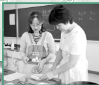
世界の料理教室の講師として