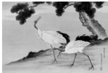
松鶴図 一幅 岸岱筆