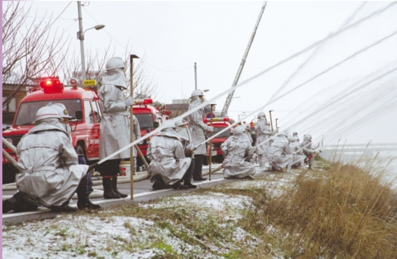
1月5日 敦賀消防団出初式