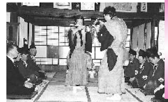
雄蝶雌蝶、 3月18日 優雅に舞う

卒園・卒業シーズンを迎え、幼児(保育園)からお年寄り(いきいき生涯大学院)までそれぞれの学び舎で卒園・卒業式を迎えました。トップをきって行われた看護専門学校の様子は、涙あり笑顔あり。新たな旅立ちを迎えた看護師のたまごたちの顔はみんな輝いていました。