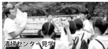
清掃センター見学