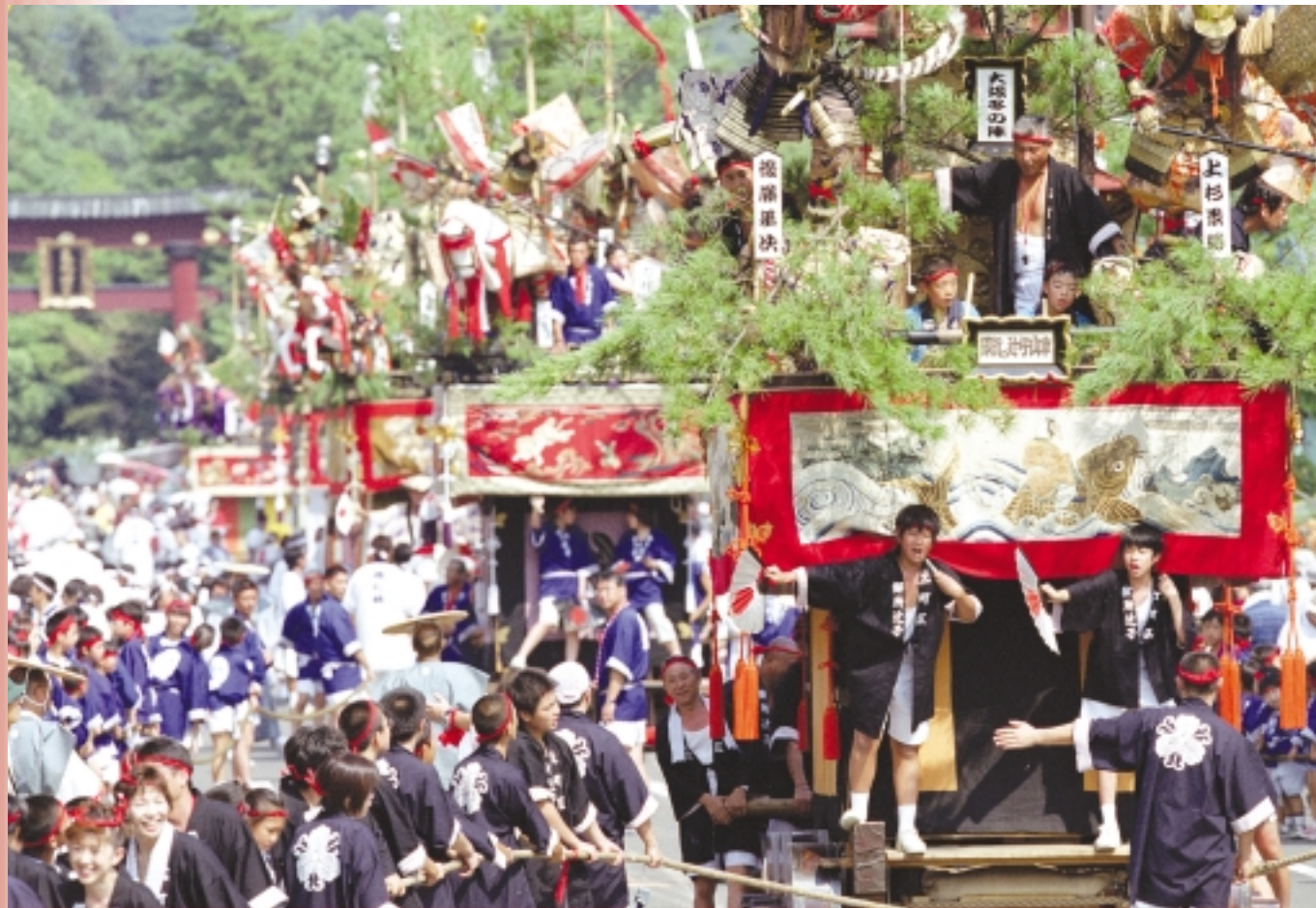
山車巡行！9月4日（敦賀まつり）