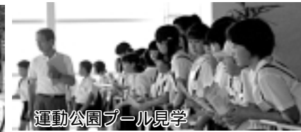
運動公園プール見学