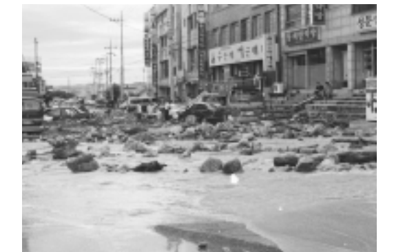
東海市の被害の様子