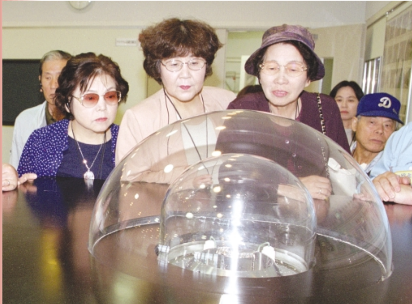
目で見る市政教室 9月27日