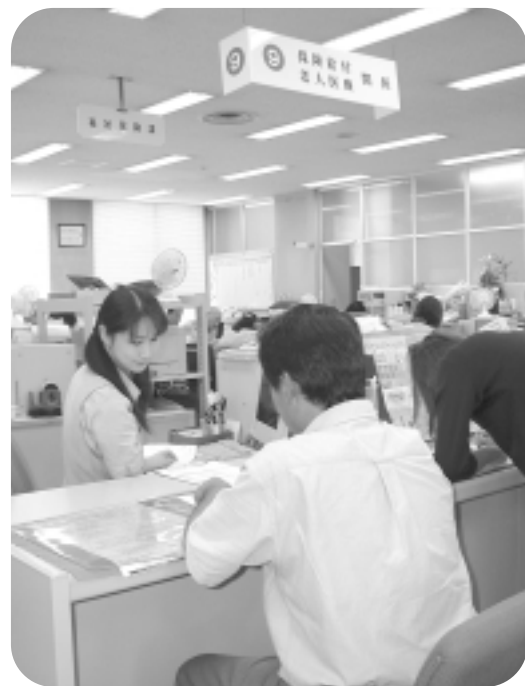
申請は、福祉保険課 番窓口へ