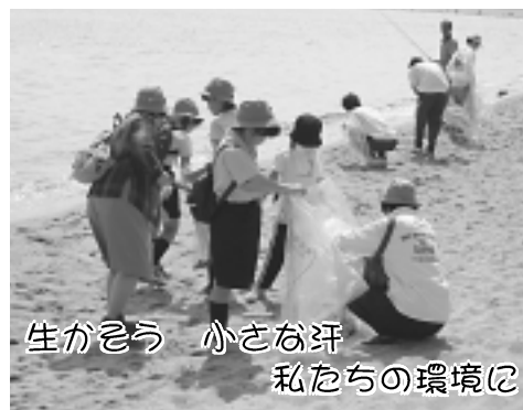
生かそう 小さな汗 私たちの環境に