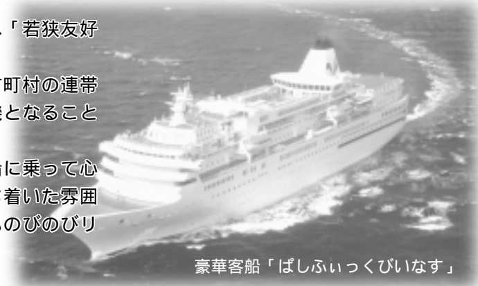
豪華客船「ぱしふいっくびいなす」

歴史の息吹と文化の香り漂う韓国に、豪華客船に乗って心くつろぐ船旅を。韓国第2の都市釜山の観光、落ち着いた雰囲気、慶州小旅行と、忙しい日常を離れ、心も身体ものびのびリラックスしてみませんか。