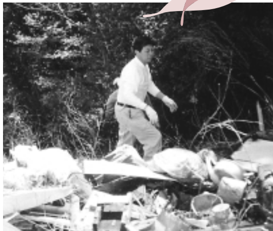
不法投棄されたゴミを撤去する市民