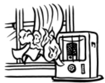
敦賀美方消防組合