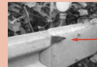
6月に、国道8号奥野付近で見つかった破片

全国のガードレール(車両用防護柵)にて発見された多数の付着金属片は、国の調査により原因のほとんどは車の接触によるものと判明しました。