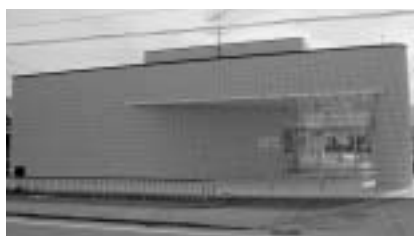
福井事務所（市野々1丁目）

10月1日に、独立行政法人原子力安全基盤機構は、敦賀市市野々町1丁目1に福井事務所を設置しました。原子力安全基盤機構は、国の安全規制強化のために平成15年10月1日に設立され、原子力の安全確保に関する専門家集団として、原子力施設の検査や安全性に関する解析・評価等を行っています。福井事務所は、発電所の現場における安全規制をより効果的なものとするために、原子力発電所の立地地域にはじめて設置され、主に県内を対象に検査業務等を行っていきます。