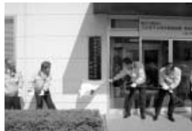
新法人看板除幕式

10月1日に、核燃料サイクル開発機構と日本原子力研究所が統合して、独立行政法人日本原子力研究開発機構が発足しました。