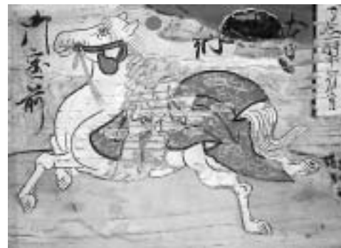
絵馬 剣神社(手)所蔵