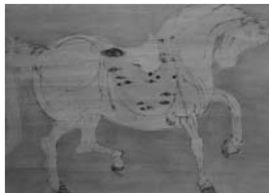
平城京跡出土絵馬 奈良文化財研究所所蔵 日本最古級の絵馬です。

敦賀には、いにしえより各地に神社があり、さまざまな人がお参りをしていました。昔の人々は、天候や戦乱等に左右される不安定な生活の中で、祈願や感謝の意を絵馬に託して奉納しました。また、絵馬は時には記念として捧げられたものでもありました。特に敦賀では、北前船の船主や船員が、海の神を祭る大坂の住吉大社に航海安全の祈願に行き、その記念や土産物として多くの船絵馬を求め、敦賀に持ち帰り奉納しました。その数は県内一といわれています。