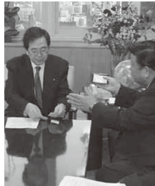
齋藤大臣(左)に要望する河瀬市長

河瀬市長は、1月14日に環境省(東京)で齋藤大臣と面会し、ごみを搬入した自治体・団体への負担請求に今後も協力してくれるよう要望しました。河瀬市長が環境大臣に直接要望するのは、今回が初めてのことです。