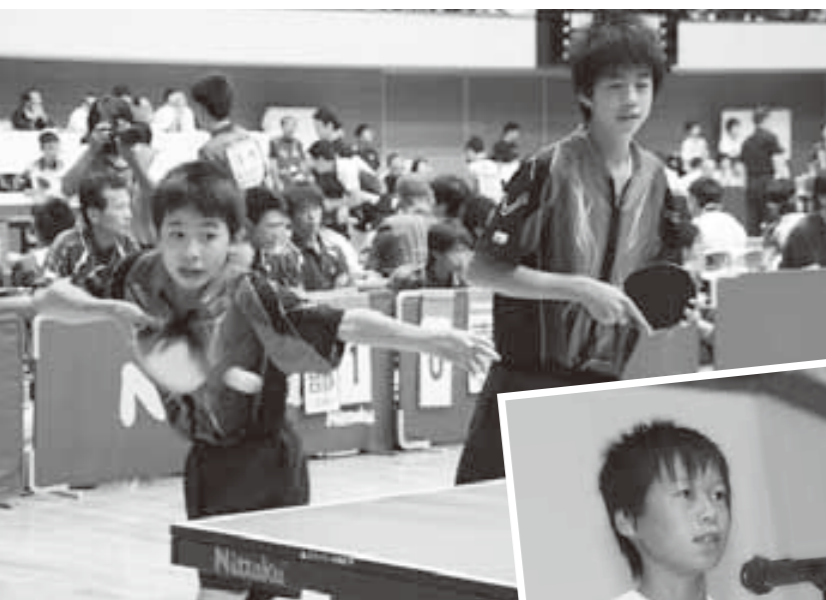
一球に集中する福井県代表の金津中学校の選手