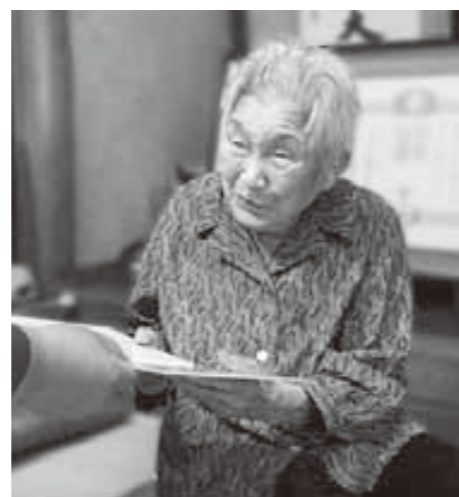
白寿を迎えた大岸さん（上）と西村さん（左）