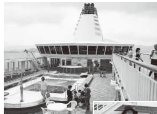
広々としたデッキを散策（上） 大きなジャグジーを発見！（右）