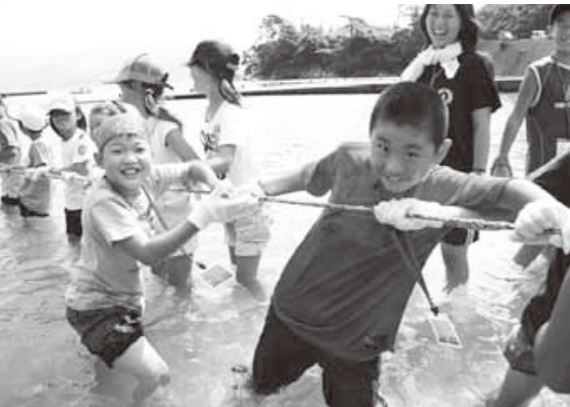
元気いっぱい地引網を引く敦賀と各務原の子どもたち