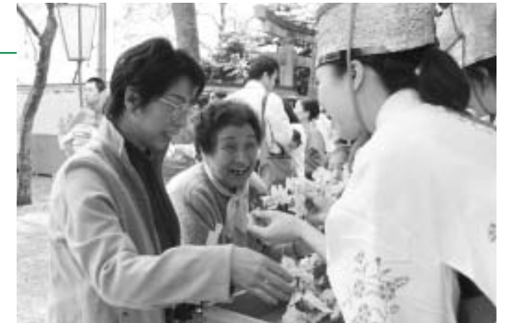
笑顔で福娘と花換え

また、和服姿で恋の成就を祈願する「恋の成就祈願祭」や、金崎宮のお守りなどが当たる「花換神事」など多彩な催しが行われ、会場は終日賑わっていました。