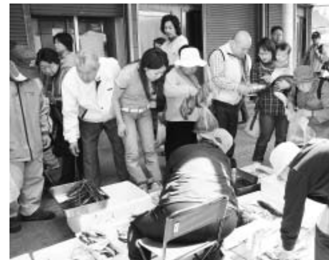
新鮮な海の幸を買い求める大勢の人

晴天となったこの日は、10時のスタートとともに大勢のお客さんが訪れ、駅前には終日賑わいをみせていました。