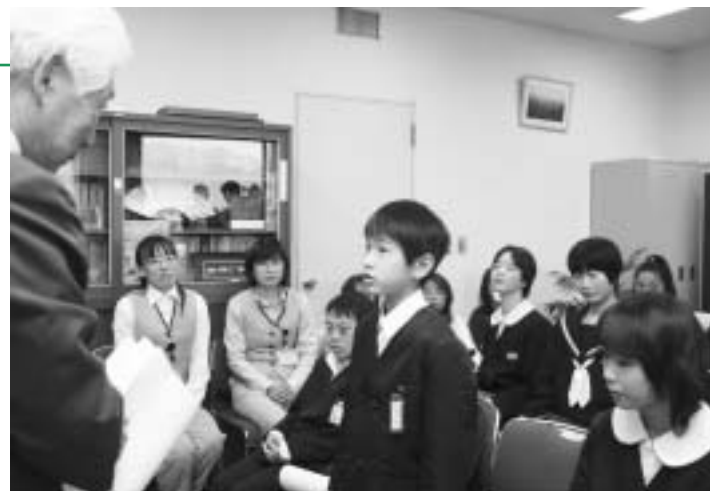
教育長と言葉を交わす子どもたち

今後、子どもたちは60日間の練習をこなし本番に臨みます。なお、今回は、闘病する二人の少女が病院で心を通わせ、金崎宮の花換えまつりで桜の小枝を交換することを誓う物語となっており、9月27日に市民文化センターで昼夜2回公演を行います。