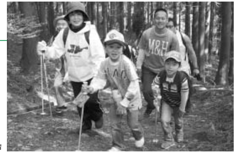
自分のペースで登山を楽しむ参加者

昨年は雨で中止となった「野坂山市民登山」が2年ぶりに開催されました。今年の参加者は216人で、最年少の4歳から最高齢の83歳まで、幅広い年齢の方が集まりました。曇り空の下、参加者らは、思い思いに登山を楽しみました。