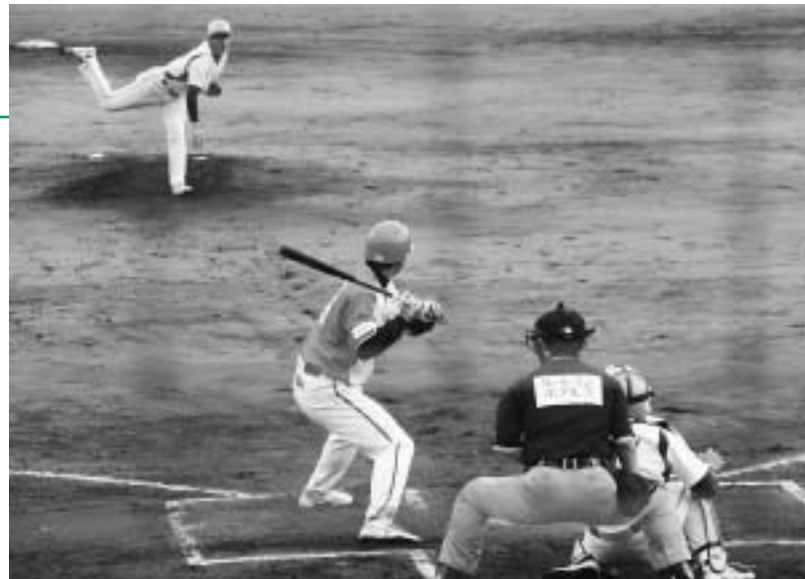
プロ同士のハイレベルな戦い

球場には県内外から約2,800人の観衆が集まり、熱い声援を送りましたが、1-4で惜敗し、初白星はなりませんでした。