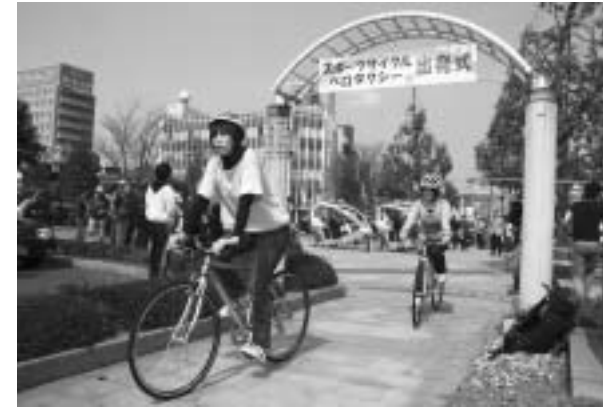
新しいスポーツバイクで出発!

今回スポーツバイクは6台導入されており、ペダルが軽く初めて乗る方でも気持ちよく市内を走ることができます。敦賀観光案内所または旧敦賀駅駅舎にて貸し出しを受け付けますので、皆さんぜひご利用ください!