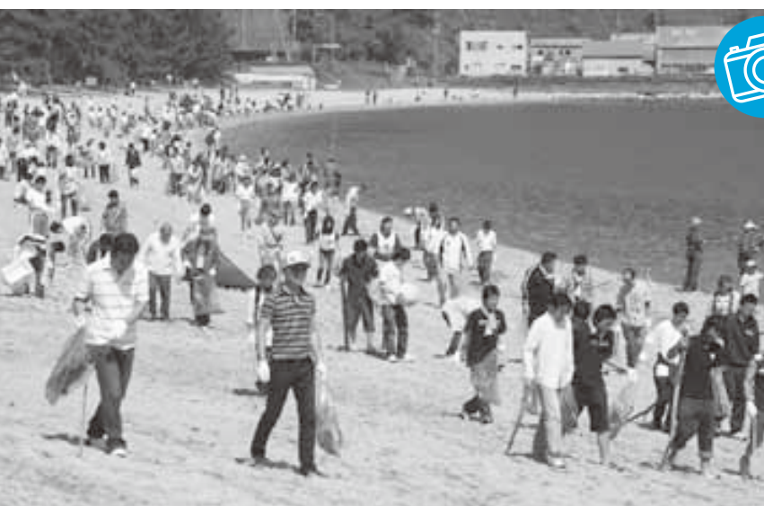
一斉に松原海岸を清掃する多くの参加者

環境月間に合わせて、恒例の市民総ぐるみ環境美化運動「クリーンアップ大作戦」が行われました。地元住民、関係団体、中・高校生など約1,200人が花城海岸に集合し、出発式の後、一斉に清掃を始めました。参加者たちは、吸い殻や紙くずなど、小さなものも見逃さないようにしながら、ゴールの松原海岸までごみ袋を片手に一生懸命作業を行いました。