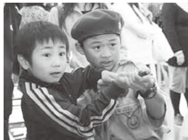
狙いを定めて発射！（紙鉄砲作り）