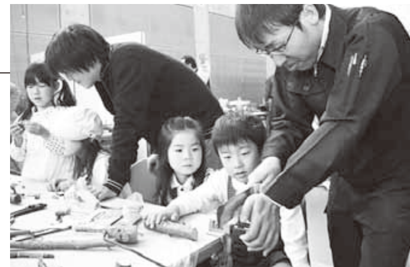
講師のお兄さんに教わりながら、オリジナルの木工作品作り

今年で26回を迎える「親子のフェスティバル」がきらめきみなと館で行われました。会場には、はた織り体験や紙鉄砲作り、木工工作や俳句作りなど、子どもも大人も楽しめるコーナーが設けられ、どのコーナーも終日たくさんの親子で賑わいました。