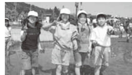
苗をもって「ピース！」