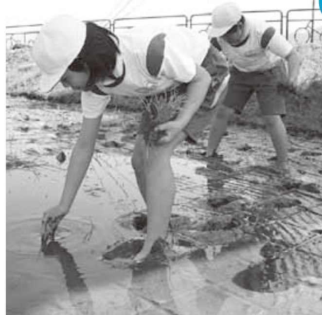
ひとつずつ丁寧に植えていきます

子どもたちは、初めて入る田んぼの泥の感触に「冷たい」と声を上げながら、ひとつずつ丁寧に苗を植えていきました。「思ったよりも大変だったけれど楽しかった。自分たちが作ったお米を早く食べたい」と、秋に体験する稲刈りを楽しみにしている様子でした。