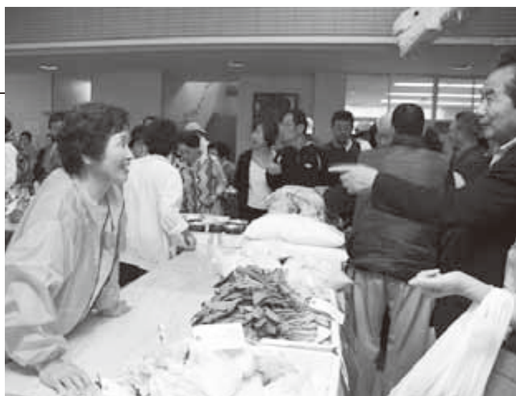
地元で採れた新鮮野菜を求め、賑わう会場

校舎1階ホールに設けた売り場には、新鮮な野菜を買い求める大勢の来場者が訪れ、用意した品物がすぐに売り切れてしまう盛況ぶりでした。今後は、今回のアンケート結果などを踏まえ、校舎活用次のステップを考えていきます。