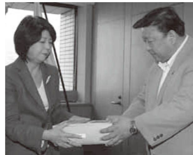
西川副大臣に、署名の一部とともに要望書を渡す河瀬市長

売却されることが決まった「サンピア敦賀」の施設機能の存続を求め、河瀬市長は、六月十一日に厚生労働省の西川京子副大臣を訪問し、要望書を手渡しました。河瀬市長は、