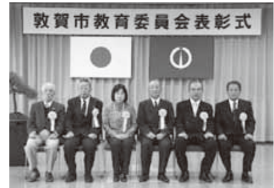
敦賀市教育委員会表彰式