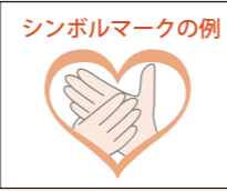
シンボルマークの例