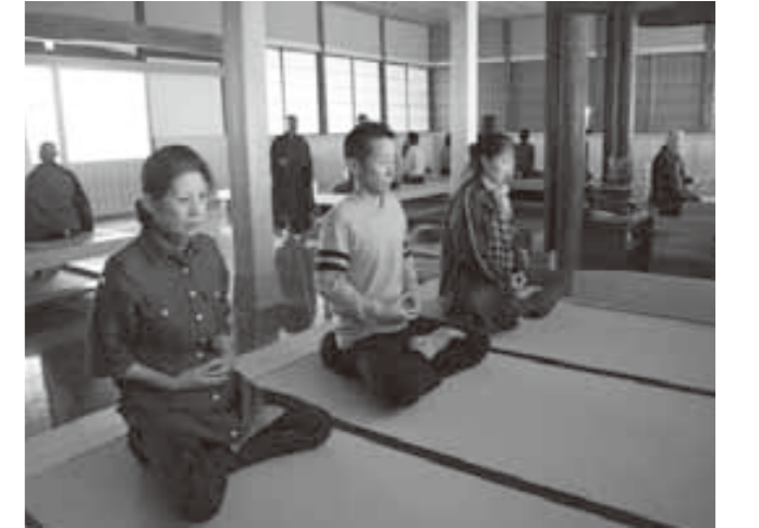
集中し座禅を組む参加者

つるが観光物産フェア2009が、2日間にわたりきらめきみなと館とその周辺、および金ヶ崎緑地で行われました。敦賀市内はもちろん、全国各地のさまざまな特産品が並んだほか、ちくわ作り体験や恒例の鮮魚セリ市、全国の醤油で敦賀の特産品を試食するイベントなど、多彩な催しが行われました。18日には料理人の森野熊八さんのトークショーなども行われ、会場は終日大勢の来場者で賑いました。