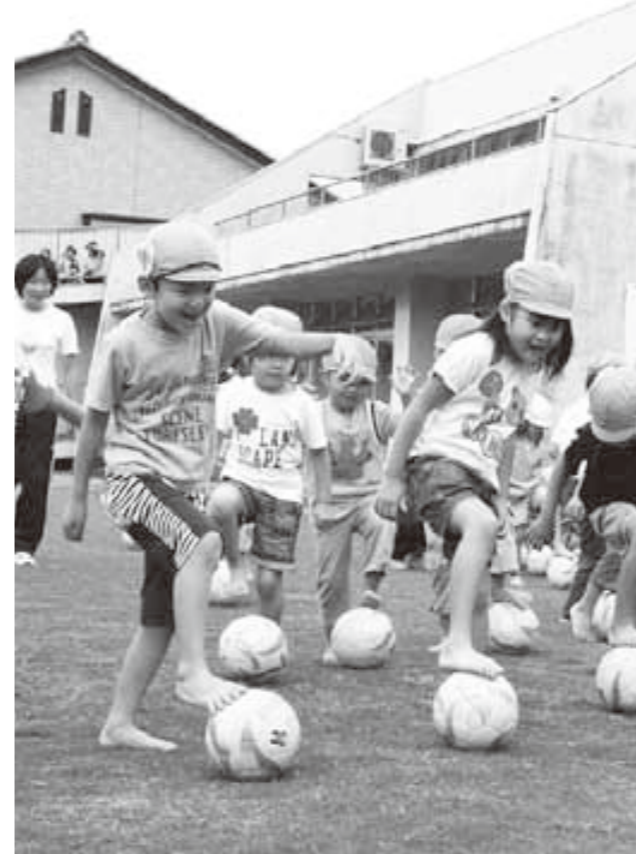
芝生の園庭で楽しそうに遊ぶ園児たち