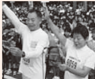
選手宣誓を行う林さん夫妻