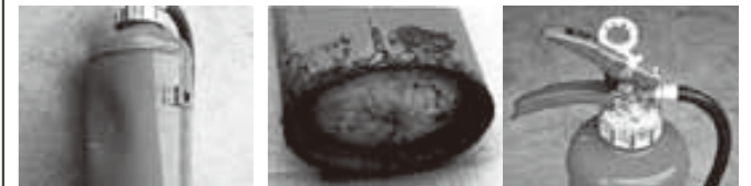
へこんでいる 腐っている・さびている

心配な場合は、お近くの消防用設備の専門業者で消火器の点検を受けてください。また、腐食した消火器を廃棄するときは、購入先、消火器の販売店、消防用設備の専門店に依頼してください。