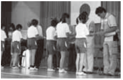
昨年7月の感謝の集いでは、子どもたちが手作りのカレンダーをプレゼント