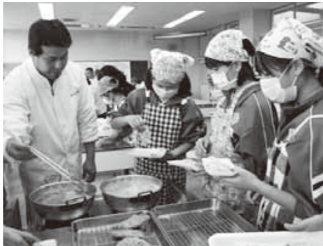
組合員に教わりながらアジフライを作る児童たち

1月29日、第82回選抜高校野球大会（3月21日開幕）に敦賀気比高校が選ばれ、2年ぶり3回目の出場を決めました。朗報を聞いた部員らは、グラウンドに駆け出し、帽子を高く投げたり、監督を胸上げしたりして、喜びを爆発させました。