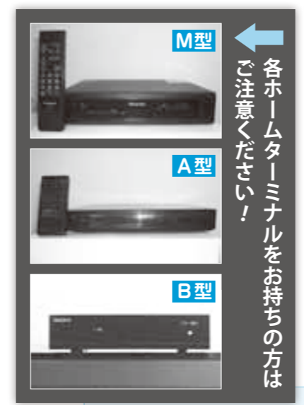
各ホームターミナルをお持ちの方はご注意ください!

なお、アナログホームターミナルの緊急告知機能に替わるものとして、今年の7月ごろから「防災情報受信機(緊急告知機能付きFMラジオ)」の設置を予定しています。それまでの間は、防災放送チャンネル、防災行政無線、インターネット、TonBoomer、広報車などで緊急情報をお知らせしていきますので、よろしくお願ひします。