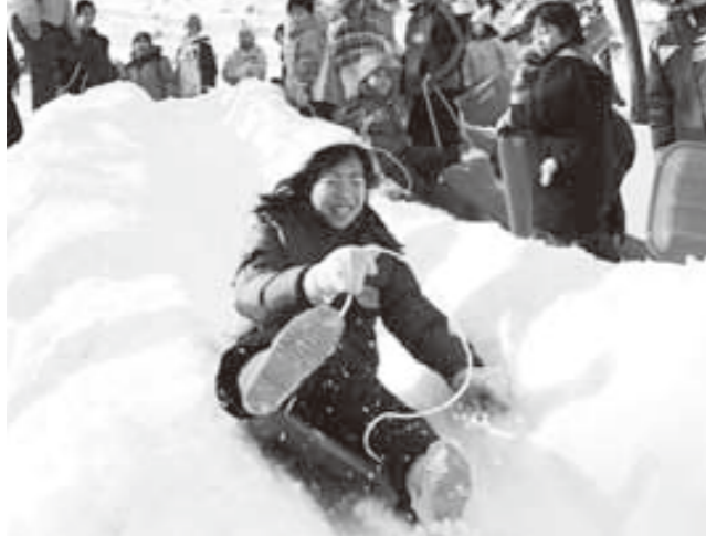
そり遊びを楽しむ子どもたち

あなたが写っていたらご連絡ください。 写真を差し上げます。 広報広聴課 ☎ 22 - 8112