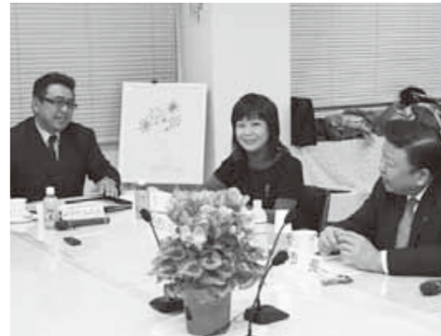
意見を交わす NPO 法人の代表者と河瀬市長

敦賀魚商協同組合が、小学生を対象に魚料理体験学習を行いました。魚食を普及させようと平成13年度から毎年実施。今年は1月と2月に、市内7小学校で実施します。この日は、東浦小学校に組合員10人が訪れ、5・6年生14人と一緒にアジフライを作りました。児童らは、組合員に教わりながらアジを上手に3枚におろし、丁寧に油で揚げ、フライを完成させました。早速試食した児童らは「すごくおいしい。家でも作ります」と話していました。