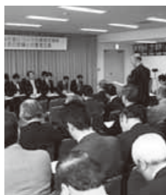
地元住民との意見交換会

第2部で行われた、地元住民との意見交換会では、市民や経済界の方など約120人が参加。「産業振興に取り組み民間が、交付金を受け取るような形を作してほしい」「地元住民が意見を言える体制を作してほしい」など、住民目線のさまざまな意見が副大臣に伝えられました。