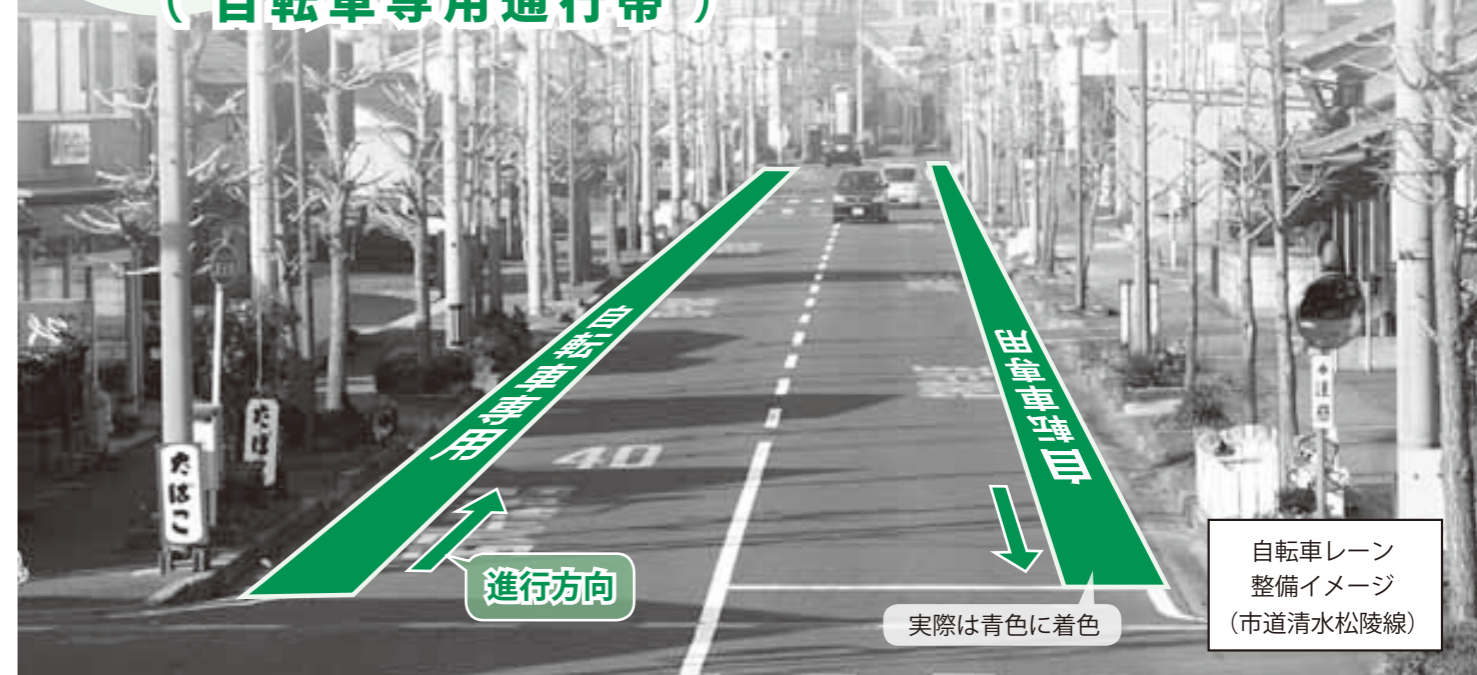
自転車レーン整備イメージ (市道清水松陵線)

「自転車レーン」(自転車専用通行帯)が市内の2路線に整備され、3月下旬から供用を開始します。これは、歩行者・自転車の安全な通行と、自転車利用の向上を目指すため、敦賀市および福井県、福井県警察が連携して進めてきたものです。