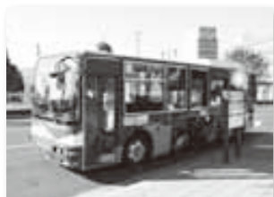
【一般会計】 コミュニティバス運行 事業費〔総務費〕

敦賀市のコミュニティバスと市内の民間路線バスを統合し、新しいコミュニティバスとして生まれ変わりました。