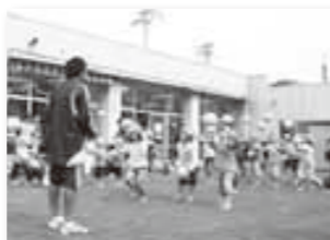
【一般会計】 保育園園庭芝生化事 業費〔民生費〕