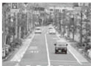
【一般会計】 自転車道整備事業費 〔土木費〕