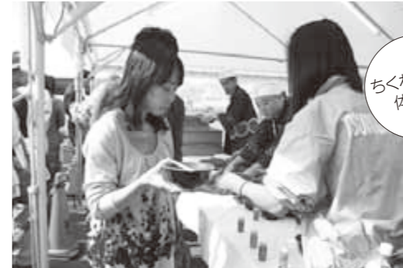
すぐに完売となった敦賀ふぐ鍋