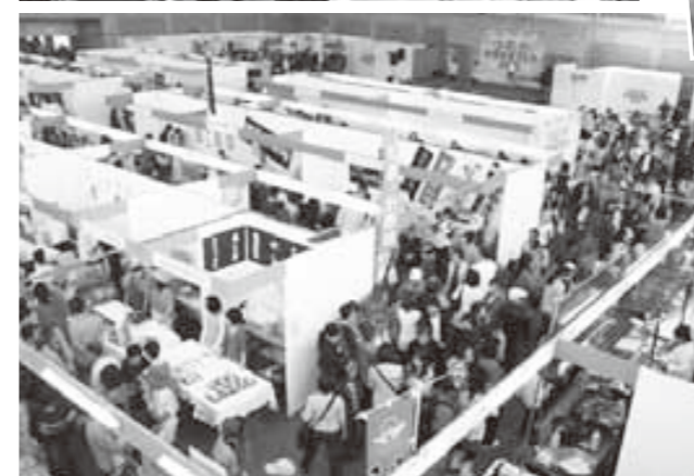
たくさんの来場者で賑わったきらめきみなと館