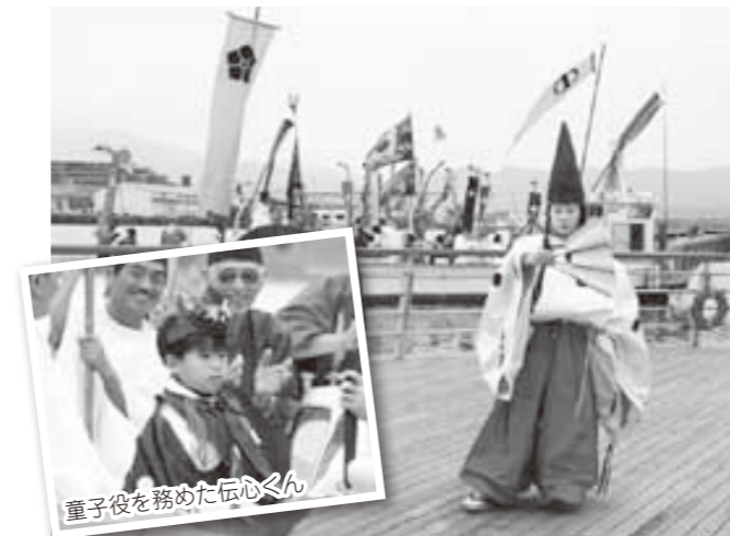
童子役を務めた伝心くん