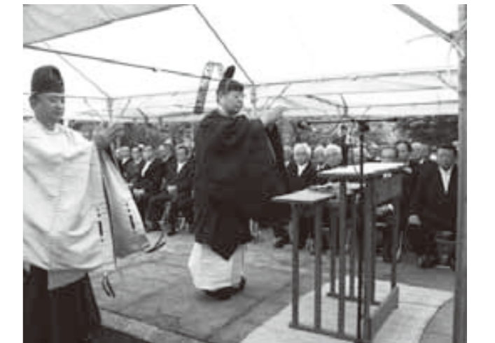
祭壇に玉ぐしを奉納