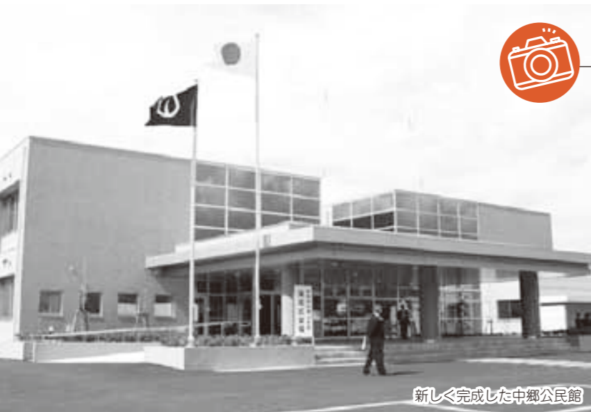
新しく完成した中郷公民館

あなたが写っていたらご連絡ください。 写真を差し上げます。 広報広聴課 ☎ 22 - 8112