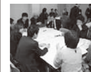
グループに分かれ議論する参加者

敦賀市のにぎわい拠点の1つ、金ヶ崎周辺について、市民の意見を取り入れ整備構想を策定するため、第1回目のワークショップが3月23日にプラザ萬象で開催されました。参加者は市民ら約30人。市が目指す「鉄道と港」のまちづくりについて説明を受けた後、グループに分かれて意見交換が行われ、レストランの整備や今ある資源の活用など、さまざまな意見が出されました。