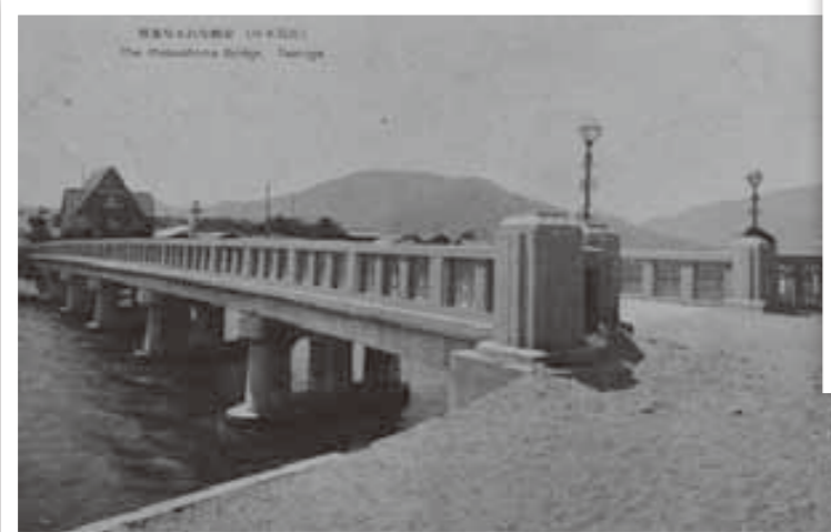
▼新しい筥ノ川河口付近、松島橋と大和田別荘〈昭和初期〉