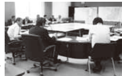
避難対応マニュアル案などを協議

この会議は、災害の想定や住民の避難方法、避難対応マニュアルの策定などについて協議するもので、各部課長ら約20人が参加。今回は、津波発生時の避難対応マニュアル案について検討したほか、災害発生時の各部署における課題や問題点などについて話し合いました。