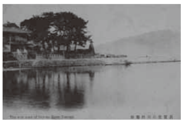
▲旧筥ノ川河口と高灯籠〈明治末～大正〉 川崎町に現存する高灯籠は、享和2年(1802)の建立。その後、昭和4年(1929)に筥ノ川は現在の形になりました。