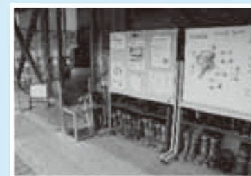
貸出の長靴も用意

また、一度に大人数の方が入館できるよう、ミュージアム(管理棟)内のリニューアルを行いました。