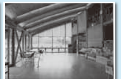
ミュージアム内も広く使えます