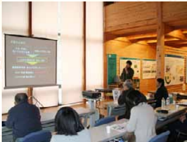
中池見湿原の研究・調査を市民に報告

赤崎区で伝統行事「山の神講」が行われました。当番宿には、裸に白の短パン姿の男子児童5人が集合。区民が見守る中、「そーれはなーのまーつりじゃ!」「やーまのかんこのまーつりじゃ!」とかけ声を上げながら区内のお堂へ向けて走りまわりました。この日は特に冷え込んでおり、一人の児童は「すごく寒かったけど、がんばった」と寒さで顔を赤くして答えました。