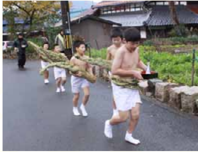
元気よく区内を走る児童たち

敦賀市卓球選手権大会の50回記念事業として、運動公園体育館で日本人初のプロ卓球選手でアテネ五輪の日本代表選手にも選ばれた松下浩二氏を招いた講習会が行われました。この日は市の卓球選手250人が集まり、松下氏から正しいフォームやカットの技術を学びました。松下氏に挑むチャレンジマッチも行われ、参加者たちは鋭いカットボールを必死で打ち返していました。