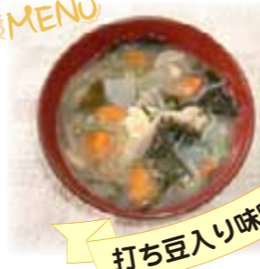
打ち豆入り味噌汁