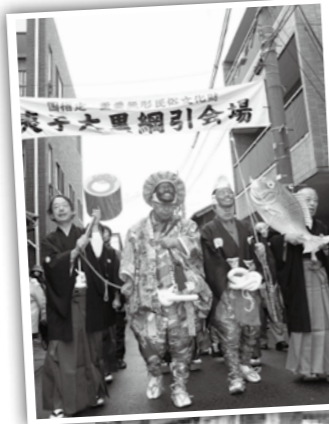
町内を練り歩く夷子神と大黒神