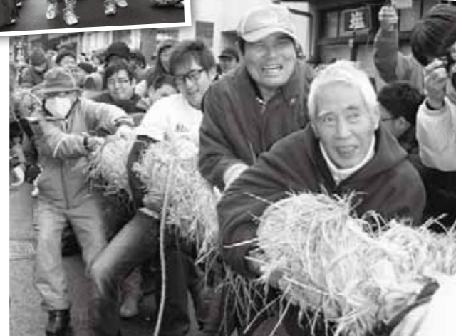
大綱を引く市民ら