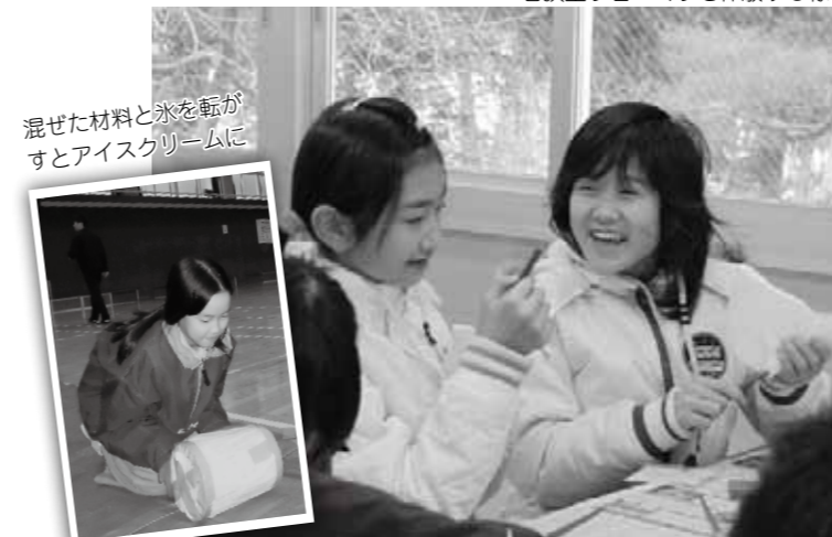
混ぜた材料と氷を転がすとアイスクリーム