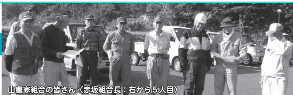
山農家組合の皆さん（赤坂組合長：右から5人目）

Q 平成23、24年度と恒久金網柵を地元の皆さんで設置して、良かった点はありますか？