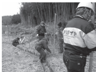
恒久金網柵設置の様子

このような獣害対策を地区全体でしっかり行い、集落営農展開への足掛かりとしていきたいです。