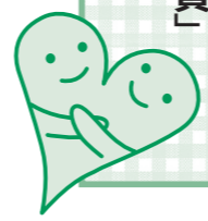
▼ひとり暮らし高齢者の安否訪問

このような不安や悩みを持つ人の相談に応じ、相談窓口となる関係機関などを紹介するパイプ役となるのが「民生委員児童委員」の皆さんです。