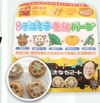
敦賀デゴイチ車輪バーグ(さなだミート)

赤レンガ倉庫をイメージし、全体がレンガ調のアイスコーヒー用のパッケージを作成。また、商品名は、ふるさと敦賀の鳥「ゆりかもめ」に命名。