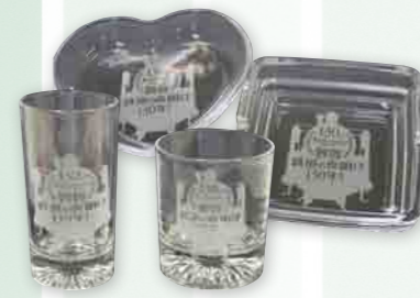
敦賀からの大切な贈り物(チェルシー)

蒸気機関車の車輪をイメージした、地元特産品使用のハンバーグを開発。包装袋には、楽しいSLのイラストが描かれており、敦賀と鉄道をPR!