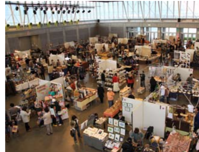
多くの来場者が訪れました

せんべいを青竹の先に挟んでかがり火で焼く伝統行事「せんべい焼き」が天満神社で行われました。この行事は、同神社内の恵美須神社で350年続くと伝えられ、焼いたせんべいを食べると無病息災になるといわれています。訪れた参拝者は、3mほどの青竹の先にせんべいを挟んで、かがり火を囲んで、せんべい焼きに挑戦。焼き上がった熱々のせんべいをほおばり「おいしい」と喜んでいました。