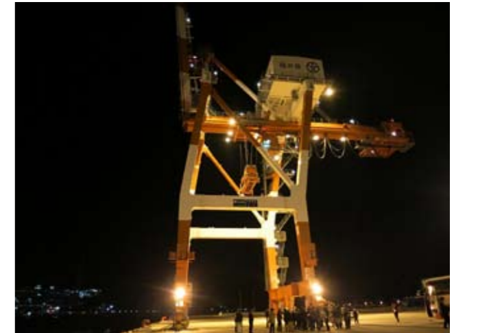
大きなガントリークレーンの見学

きらめきみなと館で「つるがクラフトマーケット」が行われました。9回目を迎える今回は、全国からクラフト制作者が集まり103のブースが出店。バッグなどの革製品やガラス細工、木製のおもちゃなど個性豊かな作品が並びました。来場者は、いろいろなブースを巡り気に入った作品を探していました。館外では、敦賀ふく鍋味覚体験などの飲食コーナーも設けられ、多くの人で賑わいました。