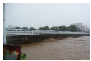
▲笹の川の水位は来迎寺橋の橋げたまで達しました

今回の台風により、河川の氾濫などの甚大な被害は免れましたが、市内各地での道路の冠水、土砂崩れが起こるなどの被害がでました。