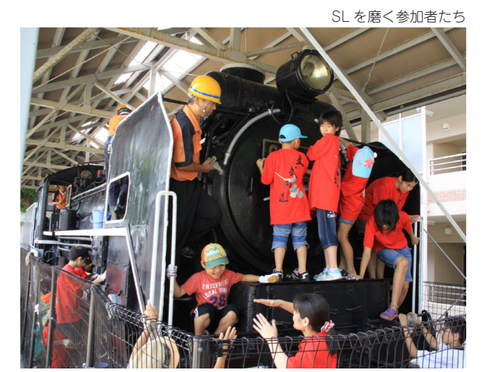
SLを磨く参加者たち

市内各地で5月に田植えを行った「田んぼの学校」の稲刈り作業が行われました。山区の田んぼでは、栗野南小学校と黒河小学校の児童121人が稲刈りと脱穀に挑戦。澄み渡る秋晴れの下、子どもたちは、慣れない稲を一生懸命刈り取りました。また、千歯こきや竹製のこき簀を使った昔ながらの脱穀方法も体験しました。収穫された米は、各学校の調理実習などで食べられる予定です。