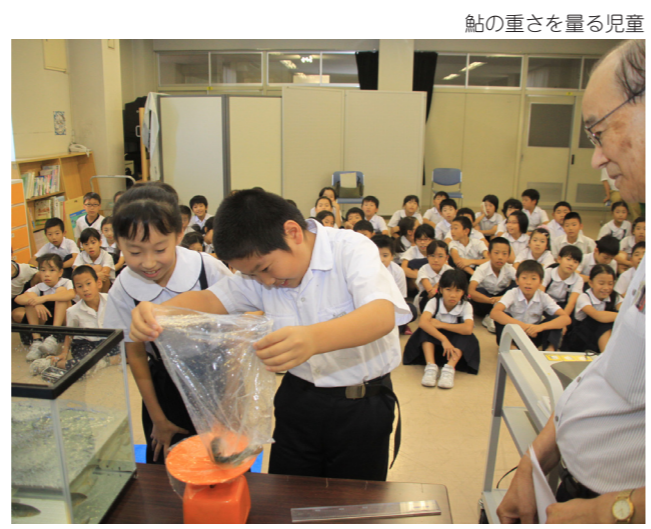
鮎の重さを量る児童