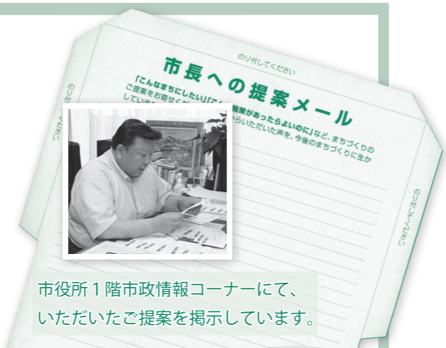
市役所1階市政情報コーナーにて、 いただいたご提案を掲示しています。

6月に募集した「市長への提案メール」では、市民の皆さんから数多くのご提案（177通）をいただき、ありがとうございました。提案は、市長が自ら目を通し、皆さんの生の声として市政運営の参考にしてまいります。今後も、皆さんの声を大切にしながら各施策に取り組んでいきますので、なお一層のご協力をお願いします。ここでは、いただいたご提案から多かったものを紹介します。