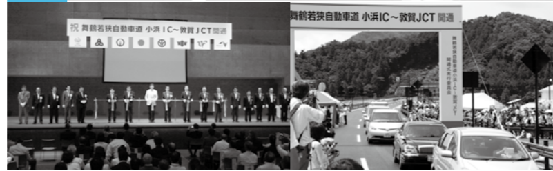
（上）開通後の黒河川橋付近の様子 （下左）雨天のため美浜町体育館で行われたテープカット （下右）三方五湖PAで行われた通り初めパレード

全線開通の当日9時30分から、美浜町体育館で記念式典が行われ、関係者ら約470人が出席し全線開通を祝いました。また、三方五湖PAでは、セレモニーが行われ、関係者や地元の住民を乗せた大型バスや乗用車約50台が通り初めとして、若狭美浜ICまでの約9kmを走りました。15時に供用が開始されると、真新しい道路を乗用車や二輪車等が走りました。