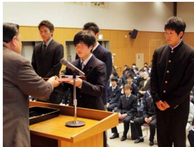
市スポーツ優秀選手の表彰を受ける受賞者の皆さん