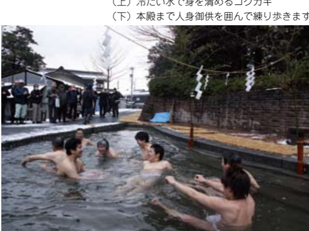
(上) 冷たい水で身を清めるゴクカキ (下) 本殿まで人身御供を囲んで練り歩きます