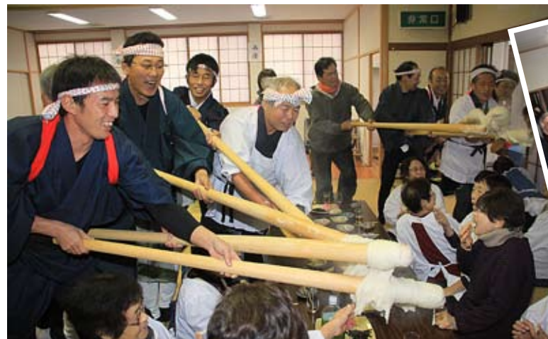
杵の先に餅をつけたまま座敷を走る男衆