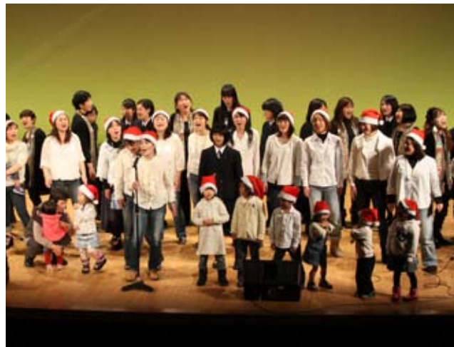
3団体合同でフィナーレを飾りました