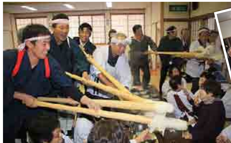
杵の先に餅をつけたまま座敷を走る男衆