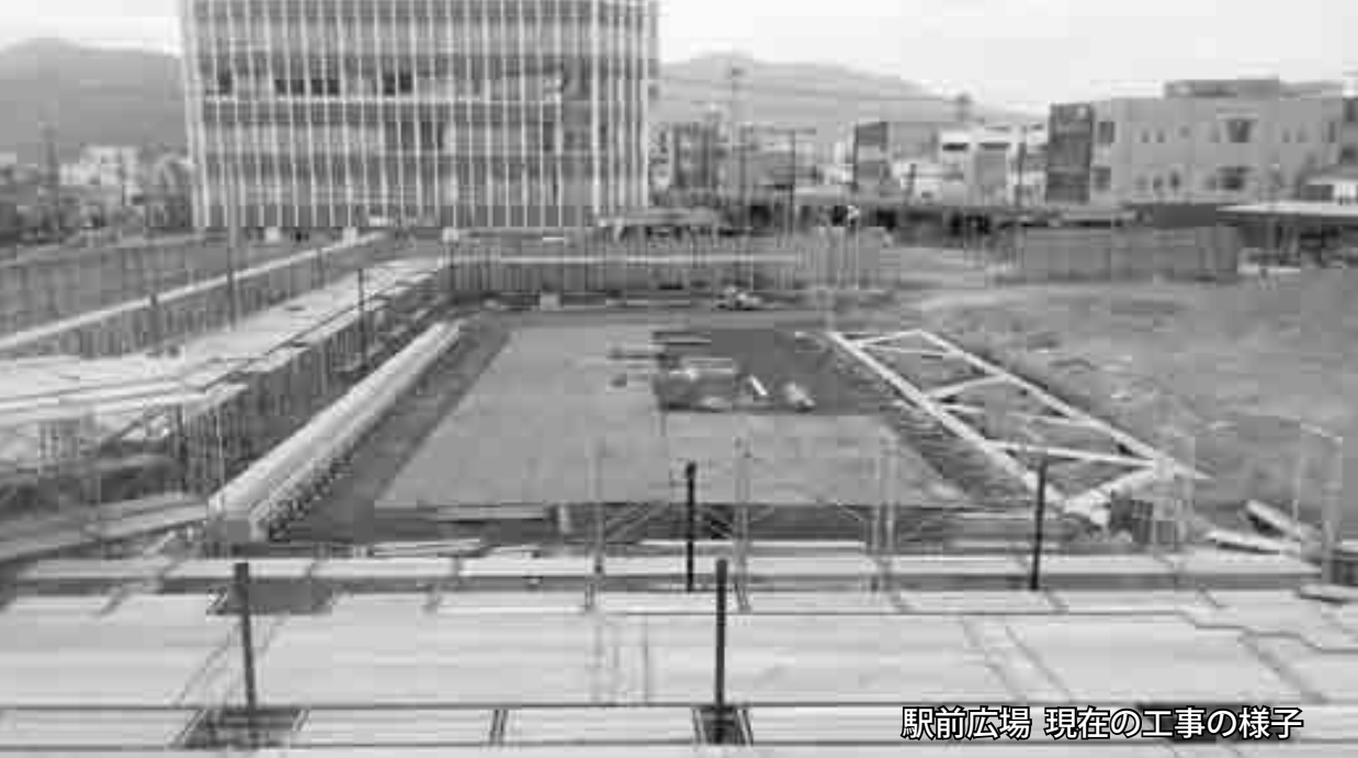
駅前広場 現在の工事の様子