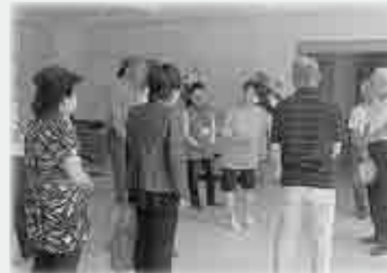
★第5地区 施設視察研修