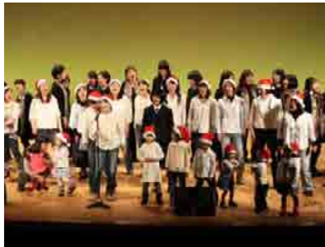
3団体合同でフィナーレを飾りました