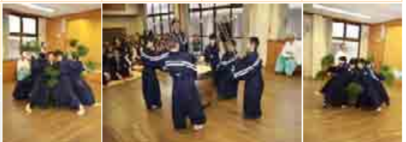
上記カレンダーは12月26日現在のものです。今後の行事などは行政チャンネルでお知らせします。