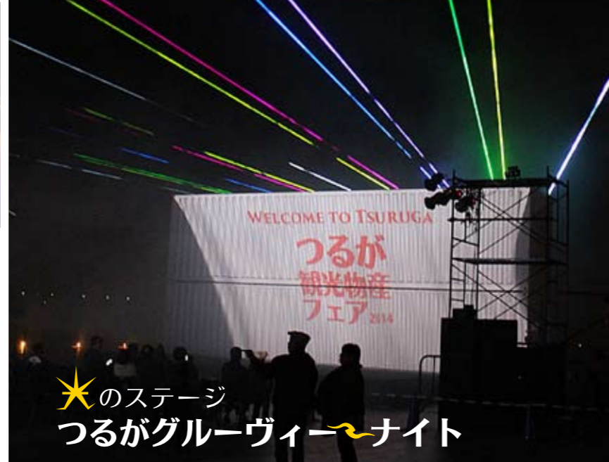
★のステージ つるがブルーヴィーナイト