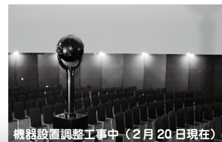
機器設置調整工事中(2月20日現在)

【問合せ先】 こどもの国 ☎25-7879 http://www.city.tsuruga.lg.jp/