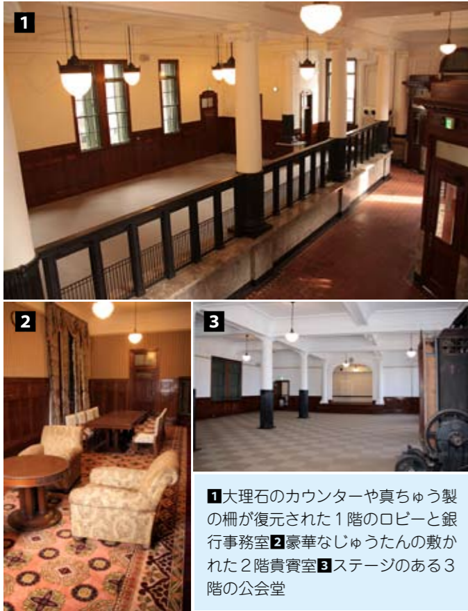
1大理石のカウンターや真ちゅう製の柵が復元された1階のロビーと銀行事務室 2豪華なじゅうたんの敷かれた2階貴賓室 3ステージのある3階の公会堂