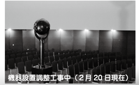
機器設置調整工事中(2月20日現在)

【問合せ先】 こどもの国 ☎25-7879 http://www.city.tsuruga.lg.jp/