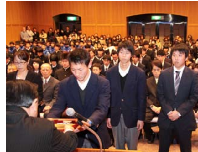
市スポーツ優秀選手の表彰を受ける受賞者

修復工事の完了を記念して、博物館の建物見学ツアーが2日間にわたり行われました。7月の博物館リニューアルオープンの時には、展示ケースが置かれるため、今回の見学会は建物そのものを見学できる貴重な機会。2日間に延べ約350人が参加し、昭和2年の建設当時に生まれ変わった建物内部を、博物館の職員の説明を聞きながら見学しました。参加者からは豪華な内装などに感心しながら見入っていました。