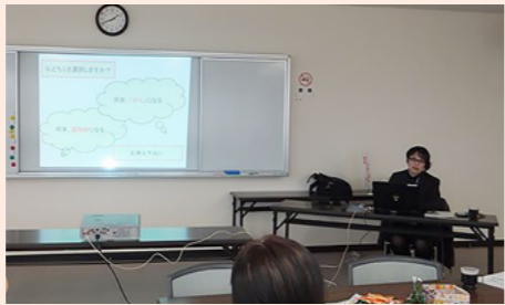
敦賀市立看護大学の先生の講話

場として、お茶やコーヒーなどを飲みながら交流を行いました。参加した方からは「介護していてストレスを感じていたけど、皆さんとお話できてうれしい」や「楽しい時間で、また参加したい」などの声が聞かれました。来年度も定期的に開催をしていく予定です。お気軽にご参加ください。