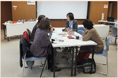
飲み物を片手に参加者同士の交流

市では、今年度、認知症や健康に関することの相談の場や、認知症の知識を学ぶ場として「敦賀つながらカフェ」を開催しました。認知症の方やその家族、認知症についての不安のある方や地域の方など誰でも参加することができ、参加者同士の情報交換、交流の