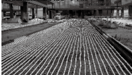
放熱管設置状況 (8月)