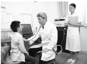
【一般会計】 子ども医療費助成費 〔民生費〕

子ども医療費の助成について、平成26年10月診療分から対象を中学校修了前までの子どもに拡大しました。