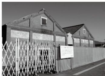
【一般会計】 赤レンガ倉庫整備 事業費〔商工費〕

平成27年10月の供用開始に向け、赤レンガ倉庫の耐震補強等工事やジオラマ製作等に着手しました。