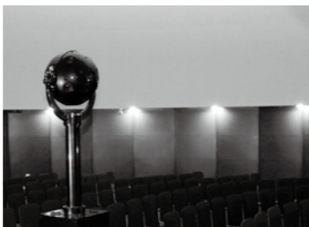
【一般会計】 こどもの国施設整備 事業費〔民生費〕

こどもの国プラネタリウムのリニューアルオープンに向け、投映機やドームスクリーン等を整備しました。