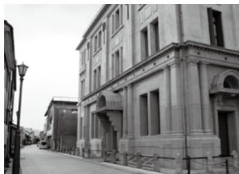
【一般会計】 博物館建物修復 事業費等〔教育費等〕

博物館通りの賑わいを創出するため、敦賀市立博物館建物の修復工事や備品の購入、隣接する駐車場の整備等を行いました。