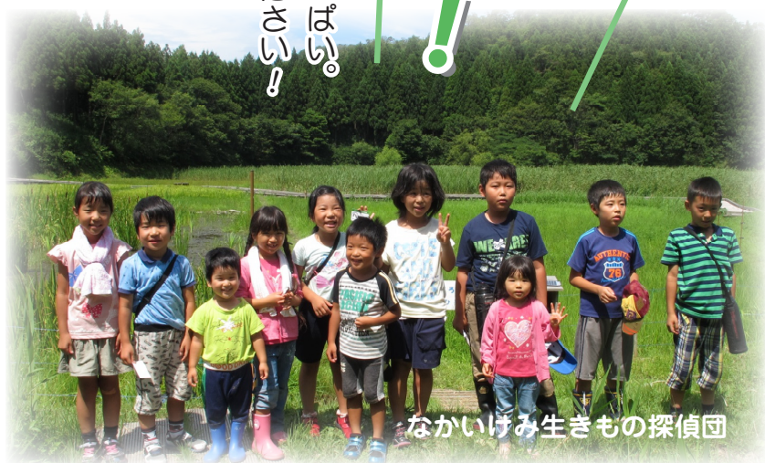
なかいけみ生きもの探偵団