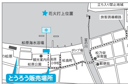
*市民観覧席購入者および団体バスで来場の観光客用の観覧席

〈販売場所〉 松原公園および松原駐車場 当日の混雑を避けるため、今年も事前販売を行います。 〈事前販売〉 8月15日(土)10時〜16時 松原公園(松原小学校横)寺院でお求めの「とろうろう引換券」との交換についても8月15日から行います。