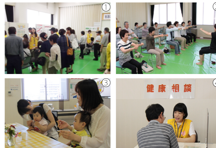
①賑わう会場 ②簡単運動 ③健康食の試食 ④健康相談

5月31日(水)、はぴふる（健康管理センター）内で、地域とふれあう健康イベントを開催しました。今後も市民の健康づくりを推進するため、年間を通して開催していきます！